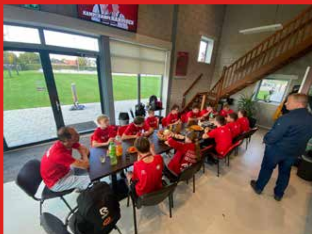
Spelers, leiders, trainersstaf: Gefeliciteerd!